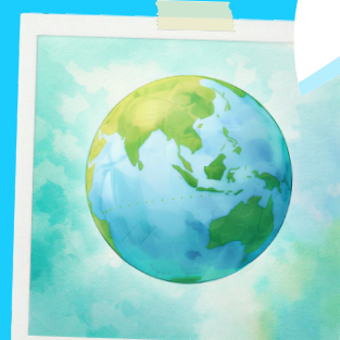
OCEANIA I FINAL