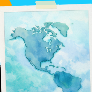
AMÈRICA DEL NORD